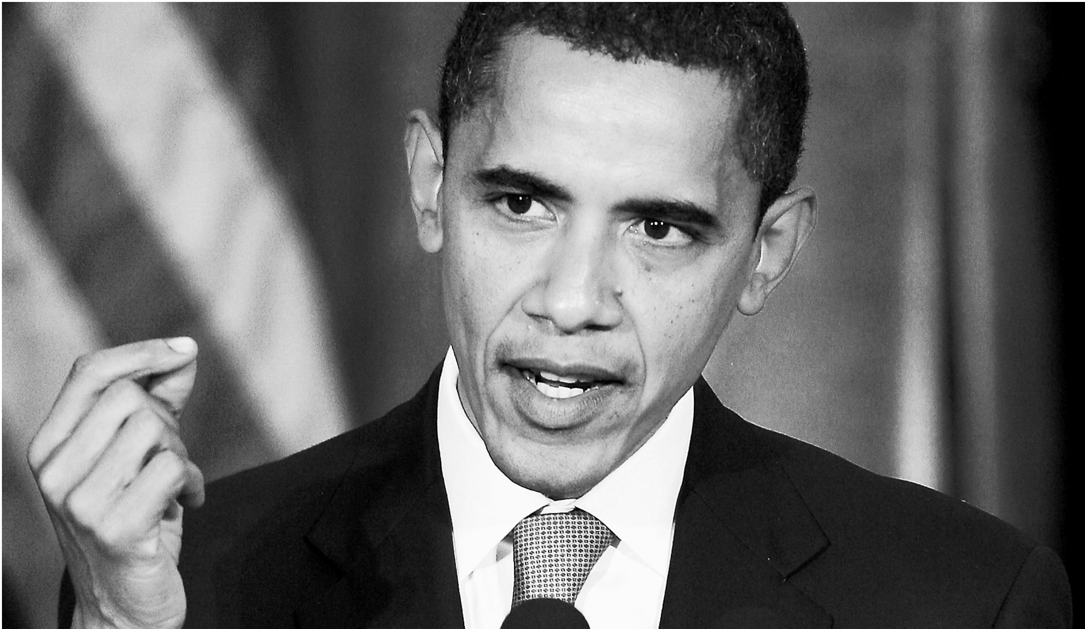
CHARLES DHARAPAK, AP - CHICAGO, ESTADOS UNIDOS

ANÁLISIS [INFORMA / TIEMPO DE LECTURA: 5 MIN.]